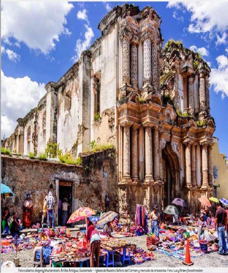
Arriba: Antigua, Guatemala — Iglesia de Nuestra Señora del Carmen y mercado de artesanías.